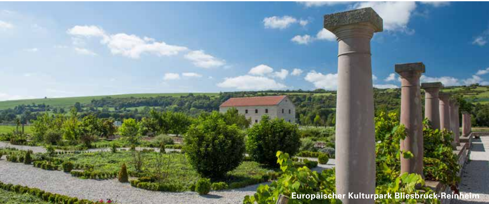
Europäischer Kulturpark Bliesbruck-Reinheim