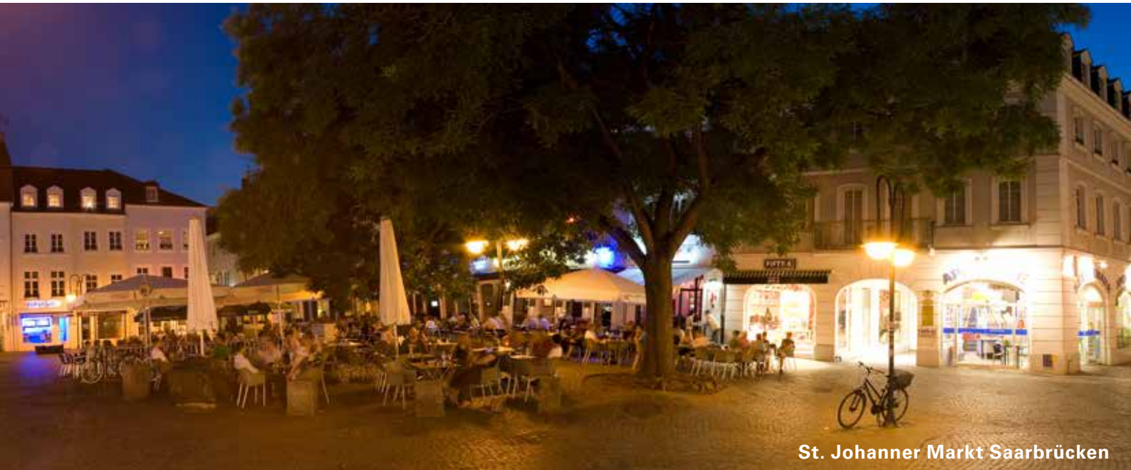
St. Johanner Markt Saarbrücken

Risikodeckungsmassen sowohl im Normal- als auch im Stressszenario die Summe der beschriebenen Risiken deutlich. In beiden Fällen ist im Rahmen einer Going-Concern-Betrachtung jeweils sichergestellt, dass selbst bei Vollaustattung der Risikodeckungsmassen noch alle derzeitigen und auch zukünftigen – soweit heute bekannt – aufsichtsrechtlichen Eigenkapitalanforderungen erfüllt werden können. Auch in einer Prognosebetrachtung auf das Ende des Folgejahres liegt die Auslastung der Risikodeckungsmassen in ähnlichen Relationen.