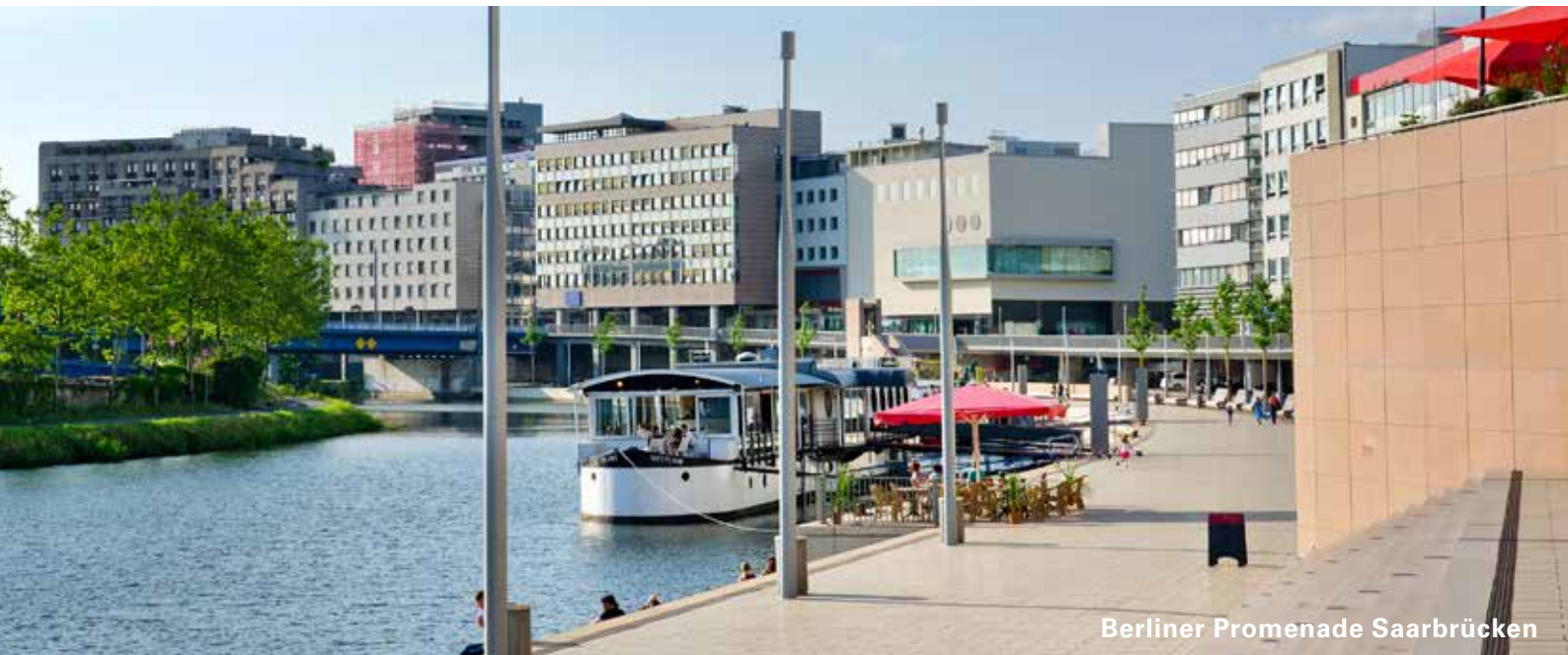
Berliner Promenade Saarbrücken

nissen gerechnet, die dann auch angemessene Spielräume zur Abschirmung eventueller Risiken aus dem wachsenden Direkt- und Konsortialgeschäft darstellen. Zudem wurden vor diesem Hintergrund bereits in der Vergangenheit Reserven zur Deckung dieser Risiken gebildet. Bei weiterhin verantwortungsbewusstem Umgang mit Risiken lassen die geplanten Ergebnisse auf Basis der aktuell bekannten Kapitalanforderungen auch in Zukunft ausreichende Zuführungen zum Eigenkapital sowie zu Reserven und Rücklagen zu.