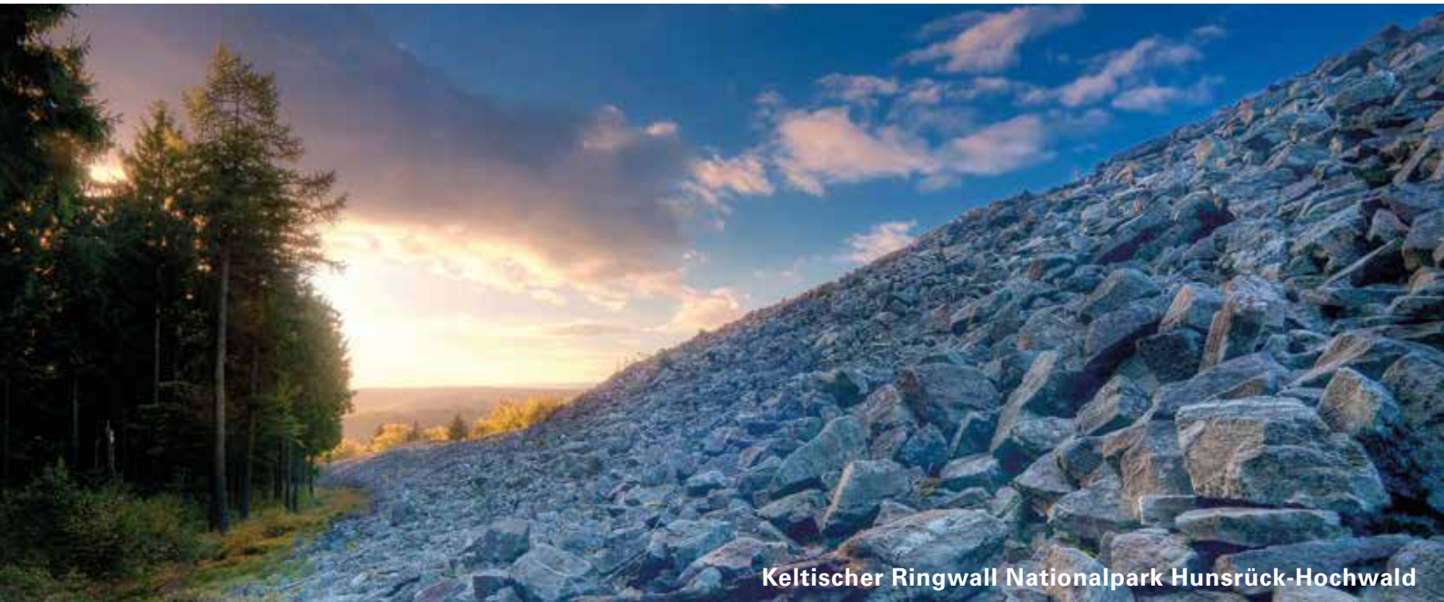
Keltischer Ringwall Nationalpark Hunsrück-Hochwald

landsprodukt im Saarland preisbereinigt um 1,5 % und damit schwächer als in Deutschland insgesamt (real + 2,3 %).