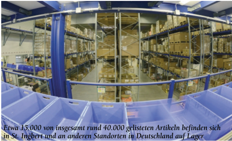
Etwa 15.000 von insgesamt rund 40.000 gelisteten Artikeln befinden sich in St. Ingbert und an anderen Standorten in Deutschland auf Lager