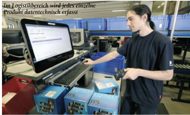
Im Logistikbereich wird jedes einzelne Produkt datentechnisch erfasst

Wachstum ihres Betriebs, was in den 1990er Jahren zu einem Umzug in ein eigenes Firmengebäude im Industriegebiet in Kirkel führte. Auch dort waren die Kapazitätsgrenzen nach einiger Zeit erreicht, so dass man sich entschlossen hat, im Jahr 2013 nach St. Ingbert-Rohrbach umzuziehen, wo die heutige Hauptverwaltung und ein modernes Logistikzentrum entstanden sind. Auch die auf dem Gelände bereits vorhandenen Gebäude wurden erworben und bedarfsgerecht umgebaut. Der Lager- und Logistikbereich ist im Zuge der unternehmerischen Wachstumsentwicklung durch einen Anbau inzwischen abermals erweitert worden. Die Finanzierung der Neubauten und des Anbaus wurde von der Saarländischen Investitionskreditbank begleitet. Dabei kamen Mittel der KfW, u.a. aus dem Energieeffizienzprogramm, zum Einsatz, die mit Tilgungszuschüssen verbunden werden konnten.