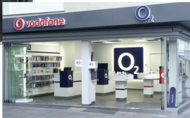
Bild rechts: Auch komplette Ladeneinrichtungen werden den Shop-Partnern im Mobilfunk-Bereich bedarfs- und markenspezifisch bereitgestellt