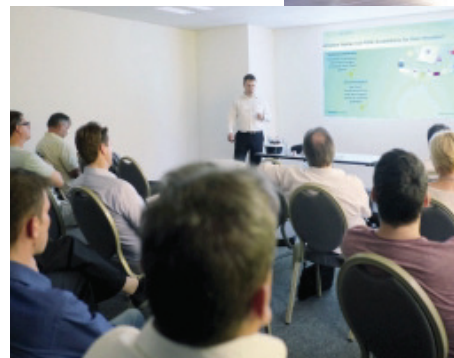
Bild links: In den Herweck-Seminarräumen werden Kunden, die aus dem gesamten Bundesgebiet anreisen, zu Produkten und deren Merkmalen geschult

Etwa 40.000 Artikel sind bei Herweck insgesamt gelistet, 15.000 davon befinden sich in St. Ingbert sowie an weiteren Standorten in Deutschland auf Lager. Von dort werden sie