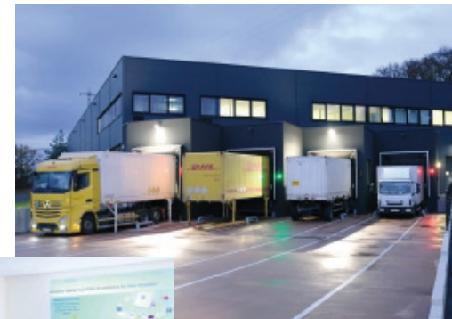
Bild oben: Jeden Tag bringen Speditionen neue Artikel zum St. Ingberter Logistikzentrum oder holen Versandware ab

auf den Weg zu den rund 40.000 Kunden gebracht, auf die Herweck im Bundesgebiet und in aller Welt verweisen kann. Dazu tra-